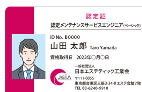
JEIA カード認定証(見本)