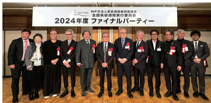
歴代実行委員長が登壇