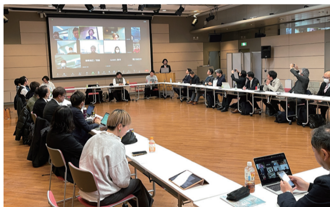
実行委員会の様子