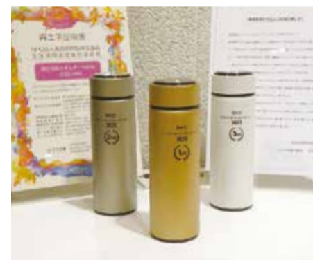
受賞者に手渡されたトロフィーはSDGsを意識したウォーターボトル