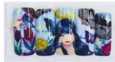
【学生】ネイルアート部門 優勝作品