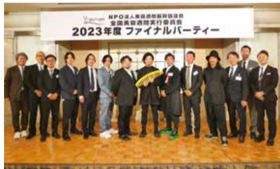
2024年度 次期執行部の紹介