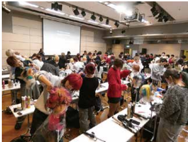
【学生・一般】ウィッグフリースタイル部門