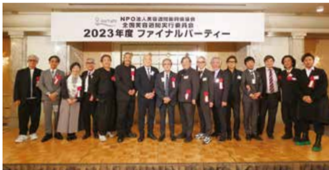
歴代実行委員長が登壇